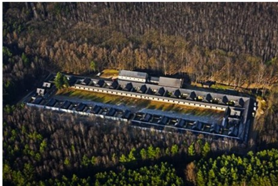
Monasterium Onze Lieve Vrouw van het Fiat Opgrimbie